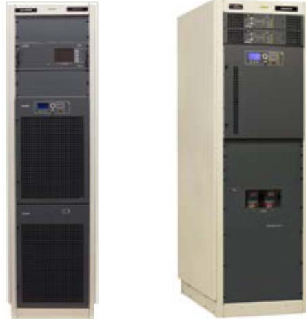
Figure 3 – New High Efficiency FM and TV Transmitters

Maxiva VAX3D (banda III VHF), Maxiva ULXT (UHF líquido) y Maxiva UAXT (UHF aire).